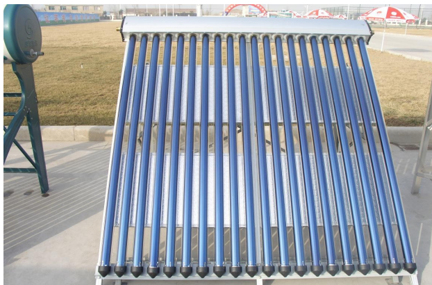
Formatervezett alumínium keret és gyűjtő